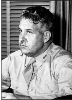
General Leslie Groves, Leiter des Manhattan-Projekts.

nach der die Deutschen bei der Entwicklung der Atombombe weit zurück gewesen sein sollen. Nach Einschätzungen aus dem Manhattan-Projekt war Deutschlands Atombombenforschung während des gesamten Krieges jener der Alliierten voraus; eine Auffassung, die auch von Projektleiter General Leslie Groves geteilt wurde. Doch nach dem Krieg war plötzlich alles anders. Nicht nur war nun Amerika weit voraus, es war, der Legende nach, auch während des gesamten Krieges immer weit voraus gewesen.